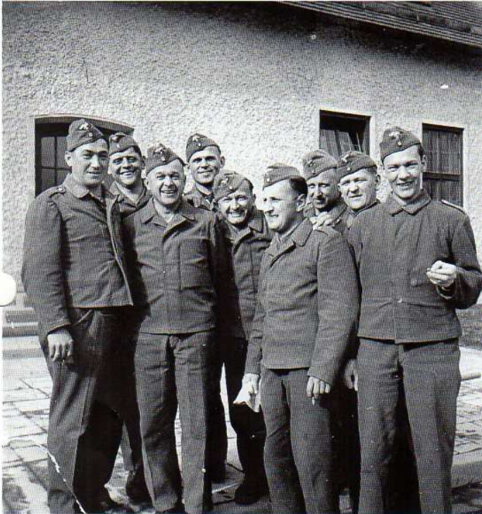
Hindelanger Rekruten bei der Luftbeobachter- Ausbildung in Augsburg, 1939 (Namen siehe Text)

Traditionen pflegen · Heimat erleben · der Zukunft bewahren